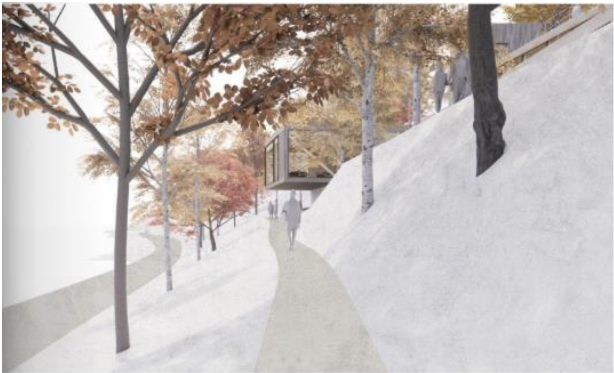
11 Tilkomst frå vegen, kafeen dukkar gradvis fram blant trea, skisse Erik Langdalen arkitektkontor

Visningscenter Astrup Brosjyre Visningscenteret ved Astruptunet