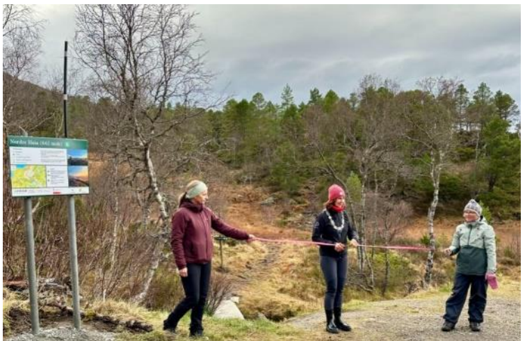
19 Bilde frå opning av oppgradering av tursti Nordheia

Planen er vedlegg til temaplanen for kultur, frivilligheit og inkludering. Miljødirektoratet har det nasjonale prosjektansvaret for friluftslivets ferdselsårer og fylkeskommunen er regionalt prosjektansvarleg og bistår kommunane med m.a. tilskot og rettleiing.