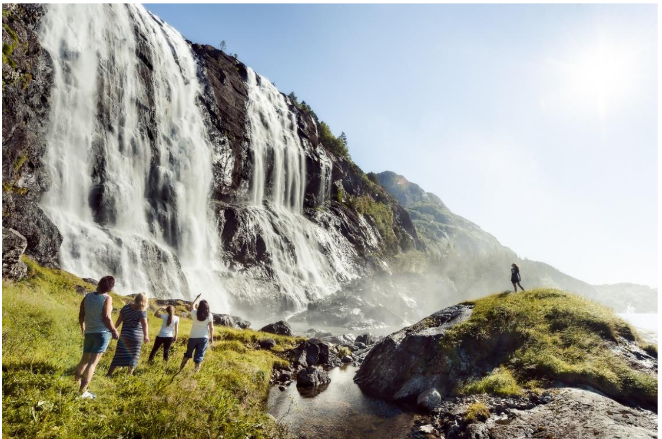
3 Fossar i Sunnfjord

Eininga jobbar med oppfølging av kommunale prosjekt ved bygging av idretts- og nærmiljøanlegg. Dei har ansvar for statleg sikra friluftsområde, drift av dagsturhyttene og toppturparkering, oppfølging av friluftslivprosjekt og sakshandsaming knytt til forvaltning og motorferdsel i utmark. Sakshandsaming knytt til verna område og forvaltningsansvar for tre naturreservat ligg også til eininga. Eininga har også ansvar for oppfølging av Sunnfjord idrettsråd og Friluftforum.