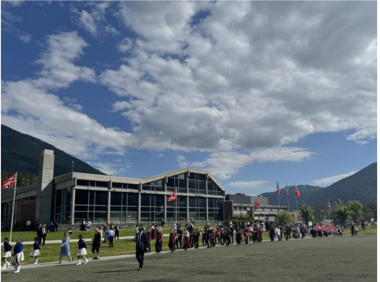
3 17. mai ved Førdehuset, foto: Sunnfjord kommune

Undersøkingar syner at barn og ungdom i Sunnfjord ønsker seg fleire møteplassar. Difor er kommunen i gang med å bygge ny møteplass på Førdehuset som skal vere eit viktig supplement til dei aktivitetane og tilboda som allereie i dag finst på huset. Samarbeid med bibliotek, kino, kulturskule, idrettstilbod og svømmehall gir ein unik moglegheit for breidde i tilbodet til ungdom. Førdehuset vil med dette få eit framtidsretta tilbod som inkluderer ungdomane i kommunen, og som gjer at ungdomane kan sjå på Førdehuset som «sin møteplass», sjølv om dei ikkje deltek på organisert aktivitet. Den nye ungdomsklubben skal ligge i dei gamle verkstadhallane til Teater Vestland.