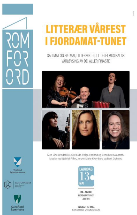
15 Plakat Rom for ord

møteplassar med autentisitet og historie som høver for temaet og forfattarskapen som skal inn i programmet.