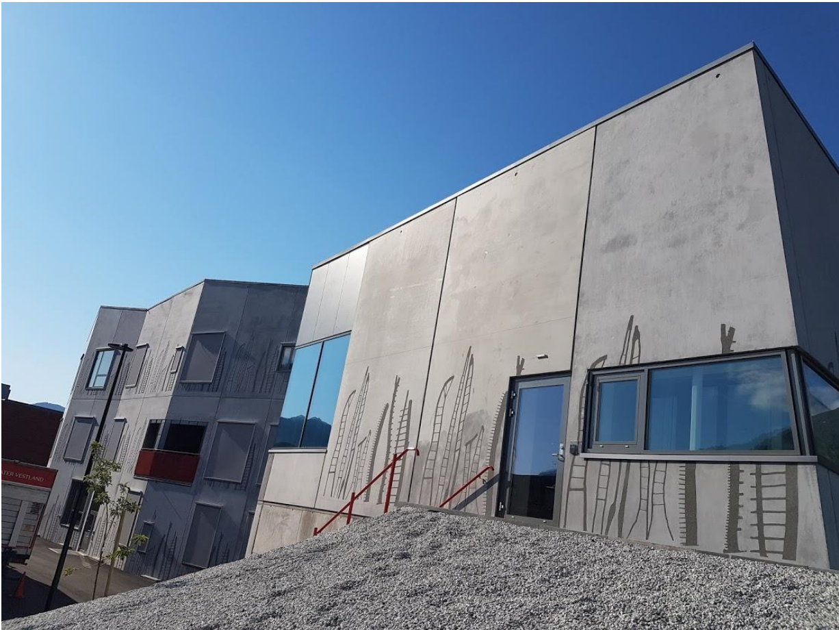
4 Sunnfjord kulturskule, Kunst på betong med gruppe MIM

Sunnfjord kulturskule har stor aktivitet og utviklingskraft, sett i høve til kommunestorleiken. Kulturskulen har gjennom mange tiår vore eit ressurscenter i kommunen for både frivillige og for profesjonelle aktørar. Skulen har 8 distriktsmusikarar tilsett i heile stillingar. Dei driv både utøvande verksemd, undervisning i kulturskulen og dirigent- og instruktørverksemd. Desse stillingane er viktige, både for å få høgt kvalifiserte medarbeidarar til undervisning og utøving i kulturskulen, og for det frivillige kulturlivet som får dyktige dirigentar og instruktørar. I 2019 tilsette kommunen to distriktsmusikarar innan folkemusikk for å ivareta lokal folkemusikk og den immaterielle kulturarven.