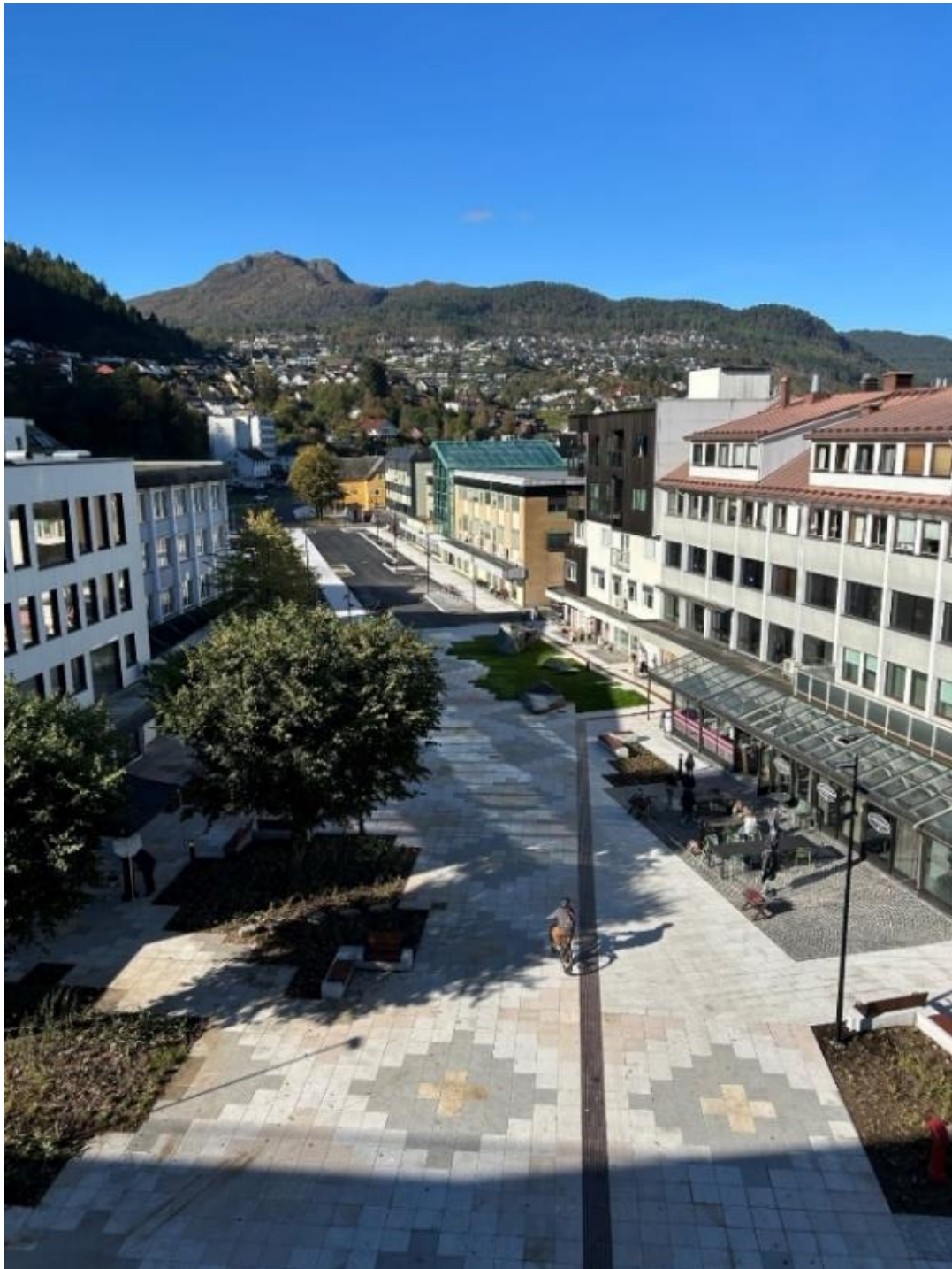
25 Åklemønster i Hafstadvegen, kunstnar Magnhild Øen Nordahl. Del av Førdepakken

Elva Jølstra renn gjennom og formar Førde sentrum. Den er eit sentralt element både i landskapet, bymiljøet og i vegutbygginga i fleire av dei aktuelle områda. I Jølstra er det mellom anna starta prosjekt med å gjenopprette laksebestand, og elva munnar ut i Førdefjorden som dei siste åra har fått mykje merksemd på grunn av gruveutvikling