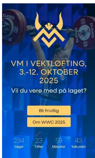
22 Plakat VM i vektløfting 2025

Sunnfjord kommune i samarbeid med Vestland fylkeskommune har støtta VM i vektløfting med til saman 15 millionar kroner. Når administrasjonen for VM har søkt departementet om ekstra støtte, er oppmodinga klar frå kommune og fylke: