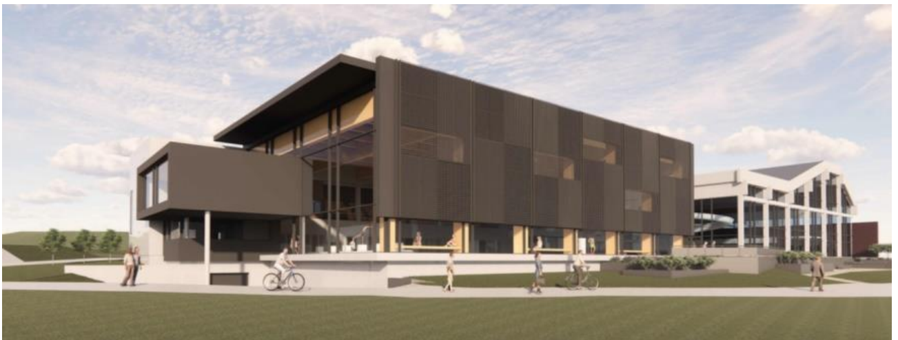
20 Skisse over nytt svømmeanlegg ved prosjektgruppa

Det er utarbeidd konkrete planar for bygging og modernisering av Førdehuset som er storstova og kulturhuset i kommunen. Dette skal sikre eigna lokale for mange og ulike kulturaktivitetar. Kommunen har ein svært utfordrande økonomisk situasjon som mange andre kommunar i dag. Likevel har Sunnfjord kommune ambisjonar om store framtidige kultur -og idrettsprosjekt. Ny svømmehall er eit av satsingsområda for framtida og eit av dei seks prioriterte tiltaka i Plan for kultur, frivilligheit og inkludering 2024–2028. Det er ein stor symjegruppe som har behov for konkurransebasseng, og det er eit stort rekrutteringstiltak.