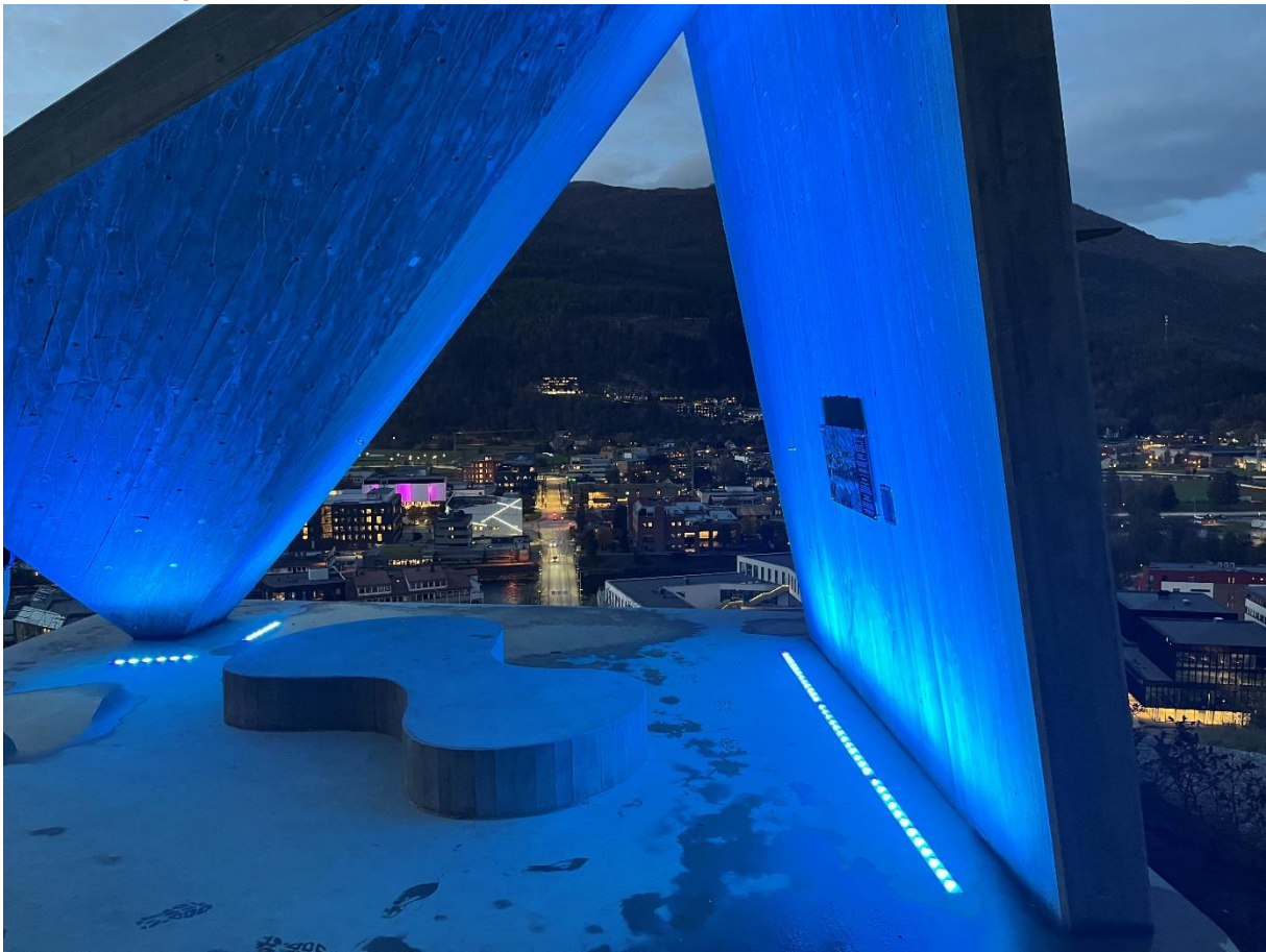
12 Vidsyn om natta

Vidsyn er ein installasjon på toppen av trappene som danner utgangspunktet for Hafstadkleiva. Det er stiftinga Bystien som har tatt initiativet til tiltaket. Vidsyn vil fungere som eit utkikkspunkt utover Førde og Førdefjorden. Kulturministeren Lubna Jaffery opna Vidsyn 04.07.2024.