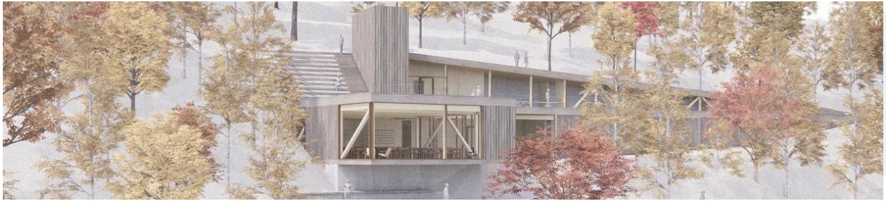
10 Visningscenteret sett frå Jølstravatnet, skisse: Erik Langdalen arkitektkontor

Visningscenteret vil supplere den 100 år gamle kunstnarheimen med naudsynte funksjonar inn i framtida med moderne fasilitetar for utstillingar av Nikolai Astrup sin kunst.