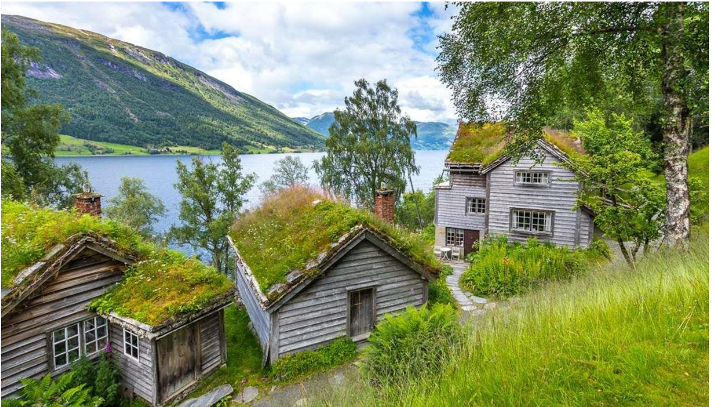
9 Astruptunet

Astruptunet er unikt som kunstnarheim i nasjonal og internasjonal målestokk. Eit restaurert hus- og hageanlegg vil saman med det planlagde visningssenteret ved tunet ha fantastiske kvalitetar for formidling av Nikolai og Engel Astrup sin kunst og virke. Sjå også vedlegg 6 kulturmiljøplanen s.16 Kunstnarheimen på Sandalsstrand.