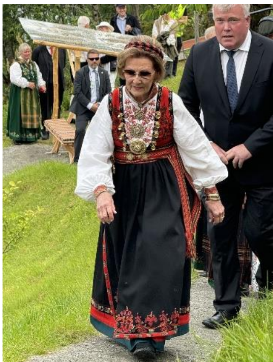
8 Hennes majestet Dronning Sonja ved nyopning Astruptunet

Astruptunet er familieheimen til kunstnarparet Nikolai og Engel Astrup. Astruptunet ligg i Jølster. Nikolai Astrup er ein av landets fremste og mest folkekjære kunstnarar, som i seinare år også har hatt stor suksess utanlands. Hagen og husa i Astruptunet har vore gjennom ei omfattande restaurering og rekonstruksjon.