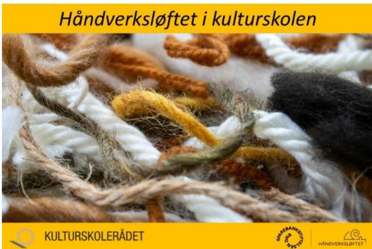
21 Plakat håndverksløftet i kulturskolen

Prosjektet « Skaparkraft i landet mellom elvane » ved Sunnfjord kulturskule er tildelt kr 500.000,- til dette handverksløft. I dette prosjektet skal vi bygge ut folkeverkstadene på Førdehuset i tett samarbeid med Sunnfjord bibliotek og Kultur og ungdom. For kulturskulen sin del vil faga visuell kunst og teater ha stor nytte av verkstadene til å lære gamle handverk, men også til å utvikle desse vidare. Målet i prosjektet er å utstyre tre rom med godt og funksjonelt utstyr til å jobbe med og lære om ulike tradisjonshandverk. Desse romma skal også kunne bookast av andre som ynskjer det både til kurs og til eige arbeid.