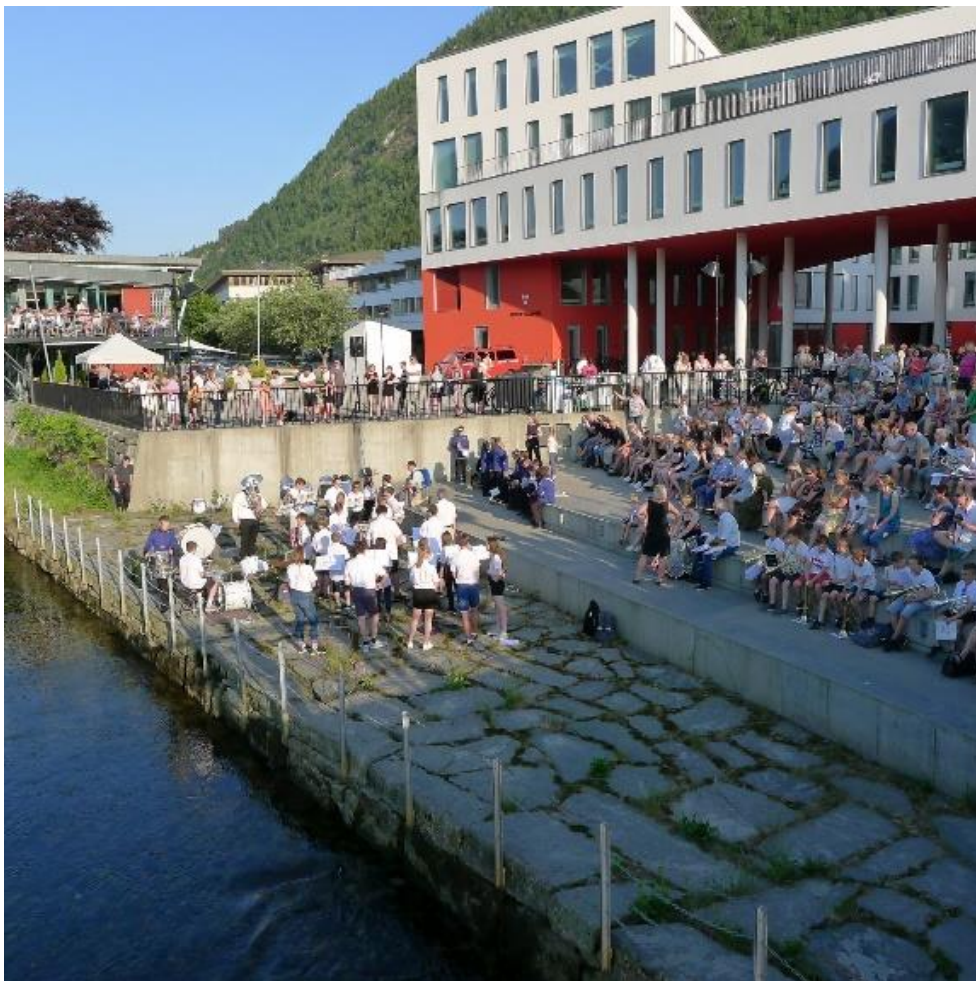
27 Kulturmatt