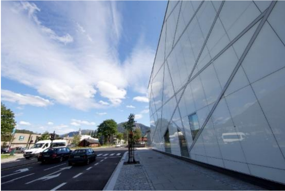
26 Kunstmuseet i Førde, foto Oskar Andersen