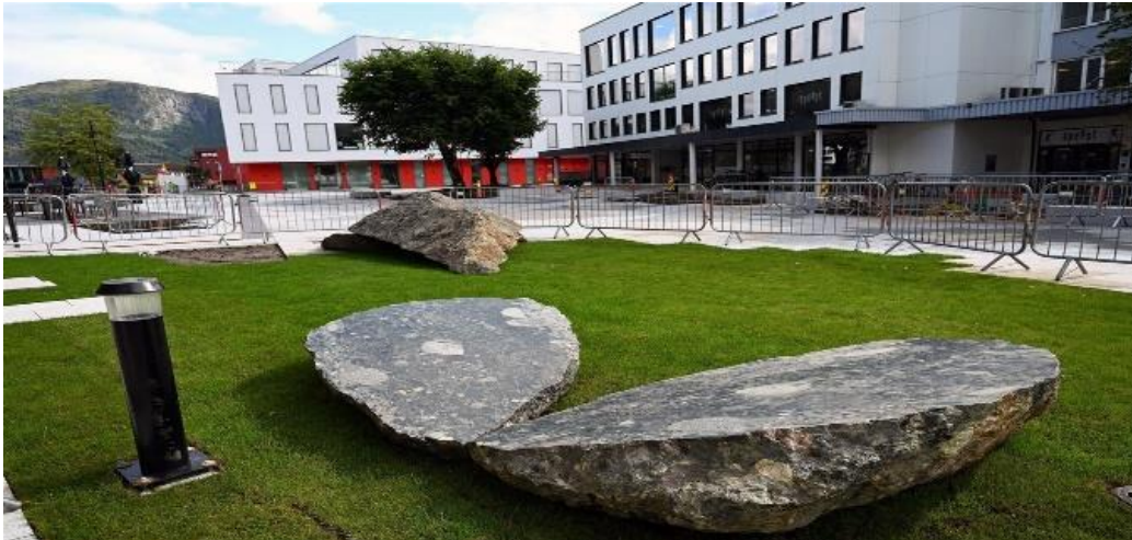
23 «Månen, dråpen og diamanten» ved kunstnar Magnhild Øen Nordahl. Del av Førdepakken

Målgruppa er særleg gåande, syklande og folk som oppheld seg i Førde sentrum. Kunstverka skal vere unike, utført i varige materialar og bli del av dei varige omgjevnadane. Kunstverka kan vere frittstående eller inngå som element i golvdekke, bruer eller anna infrastruktur. Det kunstfaglege utgangspunktet for fagutvalet som arbeider med prosjektet er å legge til rette for at kunstnarar kan utvikle eit prosjekt som går i dialog med staden der verket skal oppførast.