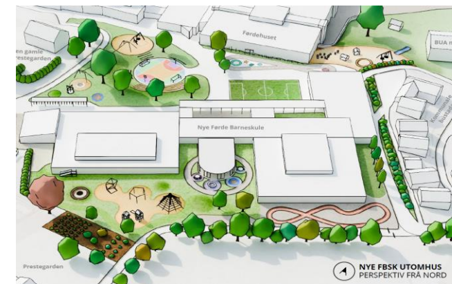
NYE FBSK UTOHMUS PERSPEKTIV FRÅ NORD

Det har vore eit godt og konstruktivt samarbeid mellom brukargruppa, arkitekt og rådgjevarar. Våren 2022 la dei fram planar som gir funksjonelle, gode og framtidretta løysingar for tenestetilbodet og innbyggjarane i bygda.