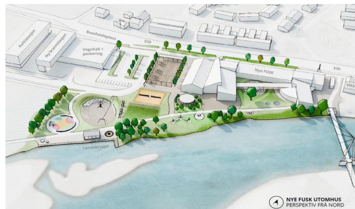
NYE FUSK UTOHMUS PERSPEKTIV FRÅ NORD