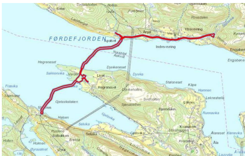
Aktuelt planområde og trase for vassleidning og kabelanlegg. Gang-/ sykkelveg i området Årset- ende av planområde i aust. Luftspenn som viser på kartet blir sanert som del av planen.

Leidningstrasé langs fylkesvegen gjer det mogeleg å gjere uttak til drikkevassforsyning og brannvatn i Vevring.