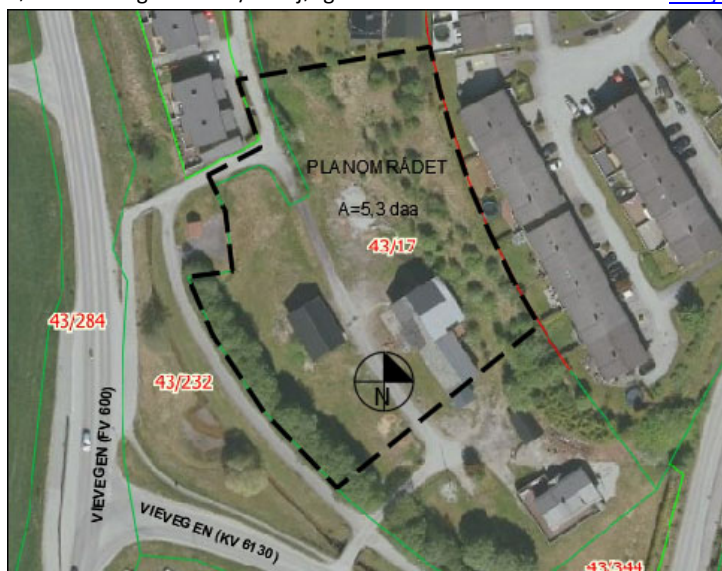
Figur1: Planområde vist med svart stipla linje på flyfoto