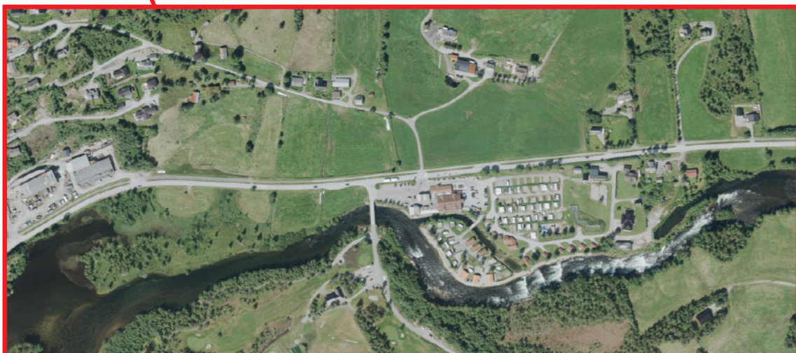
Figur 1 viser plasseringa av planområdet med raud ring.