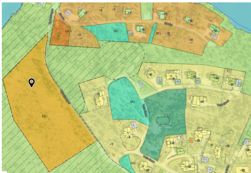
Utklipp frå kommunekart. FB1, framtidig fritidsbustar. Omsynssone myr er trekt utanfor arealføremålet FB1.

Den føreslegne arealbruken i FB1 vil redusere myra sine økologiske funksjonar både i og utanfor arealføremålet FB1. Området er truleg allereie påverka negativ av vegen som går gjennom myr, men det nye utbyggingsføremåla vil gje ytterlegare negative påverknad på attverande myr og funksjonane den har. Det er ikkje vurdert alternativ plassering på andre sida av vegen, i området som alt er bygd ned. Retningslinjer for arealbruk i Regional plan for klima nr. 17 seier at vi bør unngå å bygge ned karbonrike areal, som myr, våtmark og skog. Om tilstrekkelege kartleggingar ikkje er gjort skal føre- var- prinsippet leggest til grunn. Fylkeskommunen fremja administrativ motsegn til arealføremålet FB1 då det fører til nedbygging av eit større karbonrikt område og strir såleis mot retningslinje 17 i regional plan for klima i adminstrativ fråsegn 10.3.23. Vi stiller vidare spørsmål om arealføremålet følgjer opp kommunen sine eigne målsetjingar om ivaretaking av natur med viktige økosystemfunksjonar og arbeidet med omsynssone myr.