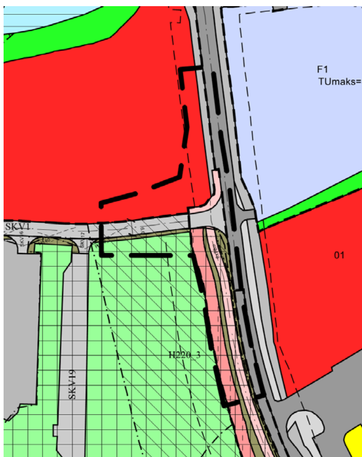
Gjeldande reguleringsplanar. Varsla planavgrensing er vist med svart stipla linje.