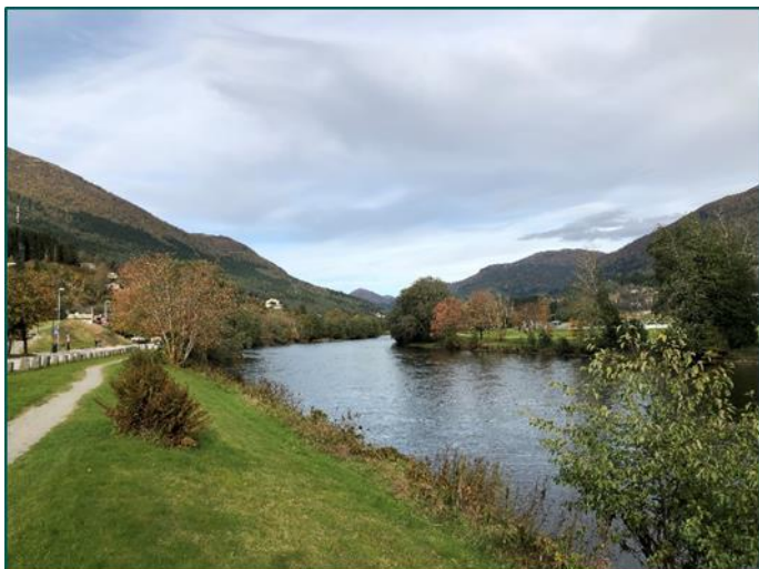
Elvekanten ved Førdehuset mot Angedalen

På Vie er det forslag om utbetring av krysset ved Viebrua, vegen som går til Vieåsen og vidare inn på Vie. Det er gode intensjonar, men samanlikna med ein del av dei andre forslaga får denne låg prioritering.