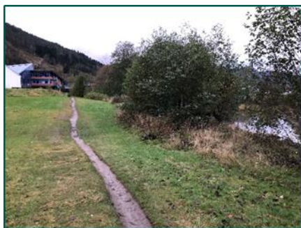
Sti ved Hafstad vidaregåande skule

Gang og sykkelveg frå Hafstadparken og til Hafstad vidaregåande skule vil vere å legge til rette der ein sti som allereie har etablert seg. Meir naturleg trase finn ein ikkje. Den vil binde saman skulen og Hafstadparken på ein god måte, og for dei som kjem frå Kronborgvegen/Viabrua og skal til Sentrum sør vil denne traseen også vere attraktiv. Den vil vere ei lenke som kompletterer gang- og sykkelvegssystemet her. Vegen er kurrant å opparbeide og vil ha god effekt for mange. Forslaget får høg prioritering.