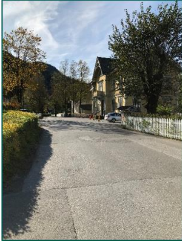
Kyrkjevegen og Gamlebanken

Tefrevegen er tilrådd skuleveg for elevar som kjem frå Vie og skal til Slåtten skule. Det er ikkje lagt til rette for mjuke trafikkantar langs med Tefrevegen, og området er tett utbygd og det er behov for ei separering av trafikkant-grupper. Denne vert prioritert høgt.