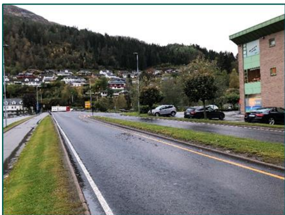
Naustdalsvegen mot sør

På rv.5; Naustdalsvegen, frå rundkøyringa med E39 til rundkøyringa Øyrane, er det ei rekkje utfordringar for køyrande og gåande. I dag er det ikkje tilbod for gåande og syklende på vestsida av Storehagen bru (Førde Torg sida), og fortauet på brua er for smal til å separere gåande og syklende. Dette fører ofte til konflikt mellom syklende og gåande. Traseen er del av hovudsykkelruta i Førde, og det er behov for ei betre løysing. Det er lista opp 3 ulike forslag; separat gang- og sykkelbru vest for Storehagen bru, gang- og sykkelløysing frå Storehagen bru og til rundkøyring ved Øyrane (vestsida) og nye gang- og sykkelløysing på austsida av Naustdalsvegen. Alle desse 3 tiltaka er kompliserte og kostbare. Dei bør spelast inn til NTP (nasjonal transportplan). Det vil ikkje vere nok midlar i potten til å gjennomføre tiltaka. Forslaget får difor låg prioritering.