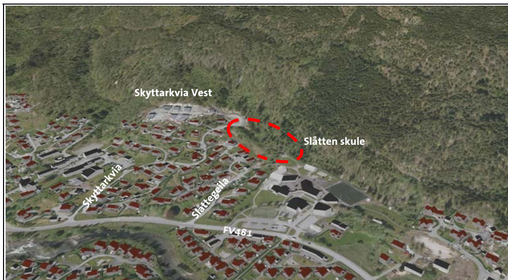
Fig.1 - 3D Illustrasjon sett frå søraust. Aktuelt område markert med raud stipla linje. (kjelde: 3d.kommunekart.no)

I medhald av plan- og bygningslova § 12-8 vert det varsla om oppstart av detaljreguleringsplan for «Skyttarkvia Aust del av gbnr. 22/2» i Sunnfjord kommune. Planområdet er på lag 10 daa, der formålet er å legge til rette for bustadar i forlenging av det eksisterande bustadområdet Skyttarkvia i Førde. Terrenget innanfor planområdet er hovudsakleg bratt med austvendt helling på 1:5 i snitt, og eit flatare område lengst aust.