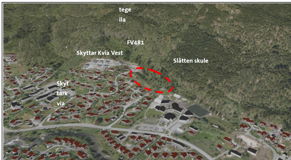
Fig.1 - 3D Illustrasjon sett frå søraust. Aktuelt område markert med raud stipla linje.

Viser til tidlegare utsendt varselbrev 02.11.2021 om kunngjøring av planoppstart for detaljregulering med konsekvensutgreiing for Skyttarkvia Aust del av gbnr. 22/2. I medhald av plan- og bygningslova § 12-8 vart det varsla om oppstart av detaljreguleringsplan for «Skyttarkvia Aust del av gbnr. 22/2» i Sunnfjord kommune med formål om å legge til rette for bustadar i forlenging av det eksisterande bustadområdet Skyttarkvia i Førde.