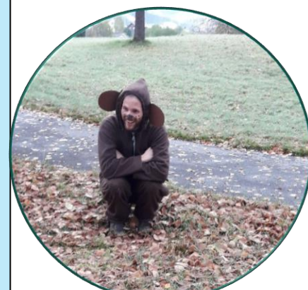
Tom som Monki på barneløpet vårt

Barnehagen samlar inn pengar som går til barneaksjonen og fadderbarnet vårt. I 2023 arrangerte barnehagen FN-kafé og samla inn 2990 kroner, i tillegg hadde vi barneløp og samla inn 3441 kr via Vipps til Forut. Tusen takk til dykk foreldre 😊