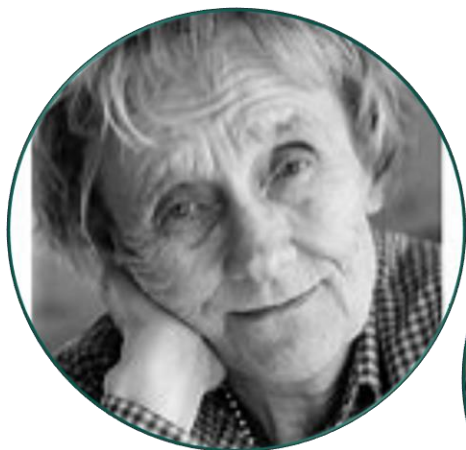
Forfattere Astrid Lindgren