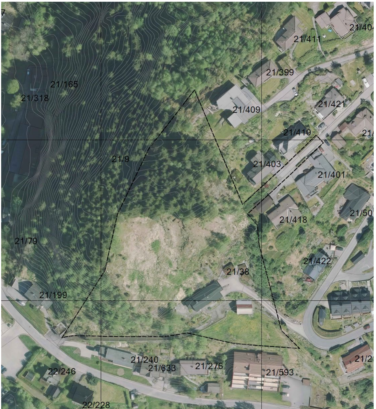
Figur 1: Planområdet si avgrensning og plassering er synt med svart stipla linje.