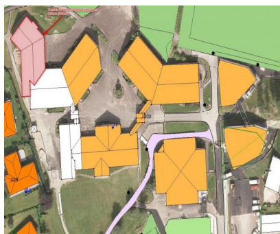
Bytte av takstein.jpg